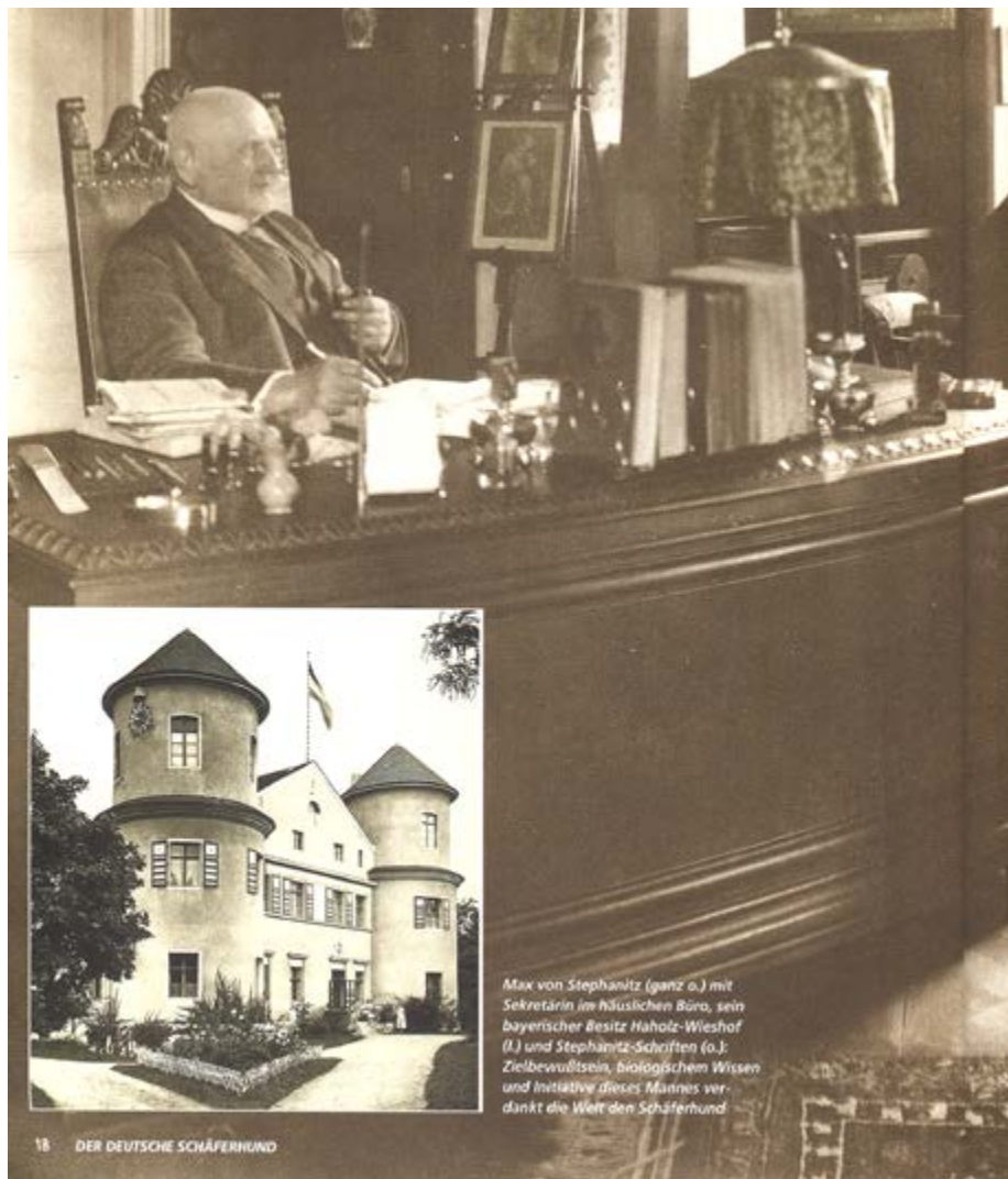
Max von Stephanitz (ganz o.) mit Sekretärin im häuslichen Büro, sein bayerischer Besitz Haholz-Wieshof (l.) und Stephanitz-Schriften (o.); Zielbewußtsein, biologischem Wissen und Initiative dieses Mannes verdankt die Welt den Schäferhund.

Очевидно, сделав Клодо Чемпионом, фон Штефанитц хотел сориентировать заводчиков на разведение более сухого типа собаки и меньших размеров. Однако, несмотря на все его указания и выступления в печати других специалистов, разводились очень крупные и сырые собаки, часто обладающие вялым и флегматичным темпераментом. Да и сам Клодо, являясь представителем линии Алекса фом Весталенхайм, характерной высоким ростом, давал крупных собак вне зависимости от подбора сук, и только его сыновья при тщательном подборе по этому признаку несколько снизили рост немецкой овчарки. Самая мощная ветвь породы, взявшая начало от Клодо фом Боксберг, получила название «Новая кровь».