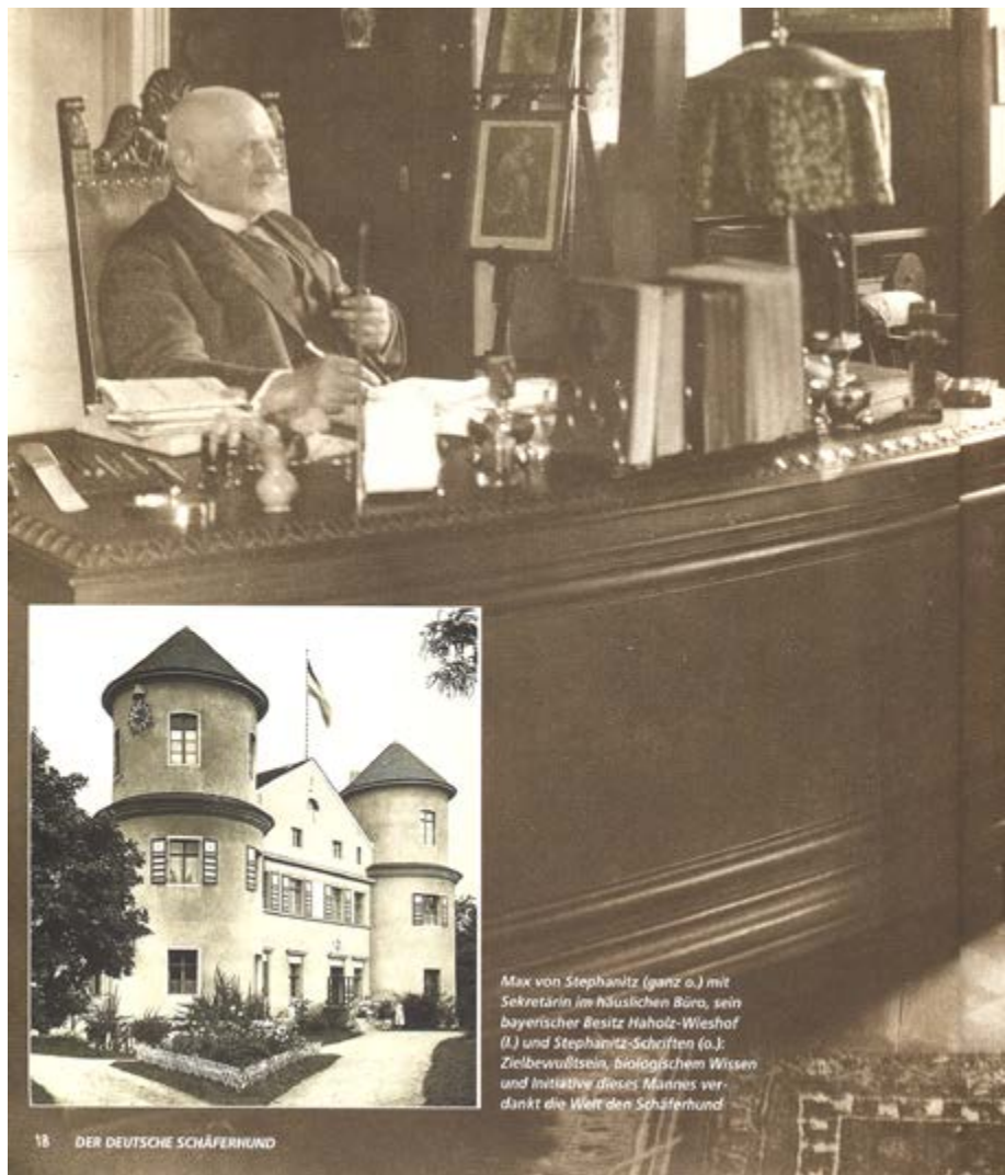
Max von Stephanitz (ganz o.) mit Sekretärin im häuslichen Büro, sein bayerischer Besitz Haholz-Wieshof (l.) und Stephanitz-Schriften (o.); Zielbewußtsein, biologischem Wissen und Initiative dieses Mannes verdankt die Welt den Schäferhund.

Очевидно, сделав Клодо Чемпионом, фон Штефанитц хотел сориентировать заводчиков на разведение более сухого типа собаки и меньших размеров. Однако, несмотря на все его указания и выступления в печати других специалистов, разводились очень крупные и сырые собаки, часто обладающие вялым и флегматичным темпераментом. Да и сам Клодо, являясь представителем линии Алекса фом Весталенхайм, характерной высоким ростом, давал крупных собак вне зависимости от подбора сук, и только его сыновья при тщательном подборе по этому признаку несколько снизили рост немецкой овчарки. Самая мощная ветвь породы, взявшая начало от Клодо фом Боксберг, получила название «Новая кровь».