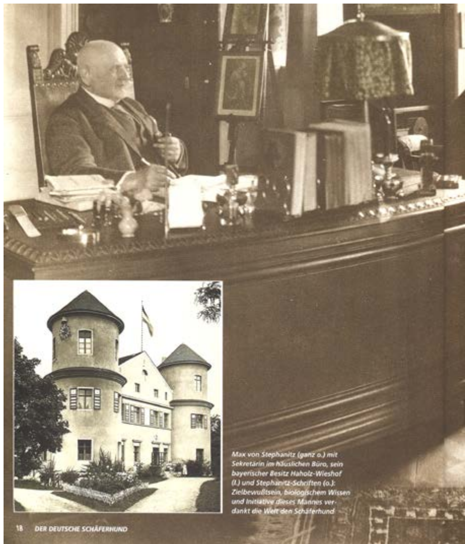
Max von Stephanitz (ganz o.) mit Sekretärin im häuslichen Büro, sein bayerischer Besitz Naholz-Wieshof (l.) und Stephanitz-Schriften (o.); Zielbewußtsein, biologischem Wissen und Initiative dieses Mannes verdankt die Welt den Schäferhund.

Очевидно, сделав Клодо Чемпионом, фон Штефанитц хотел сориентировать заводчиков на разведение более сухого типа собаки и меньших размеров. Однако, несмотря на все его указания и выступления в печати других специалистов, развелись очень крупные и сырые собаки, часто обладающие вялым и флегматичным темпераментом. Да и сам Клодо, являясь представителем линии Алекса фом Весталенхайм, характерной высоким ростом, давал крупных собак вне зависимости от подбора сук, и только его сыновья при тщательном подборе по этому признаку несколько снизили рост немецкой овчарки. Самая мощная ветвь породы, взявшая начало от Клодо фом Боксберг, получила название «Новая кровь».